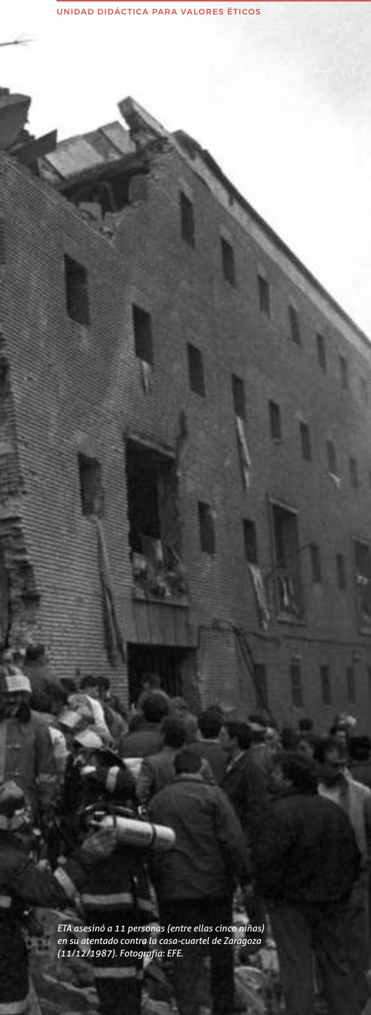
ETA asesinó a 11 personas (entre ellas cinco niñas) en su atentado contra la casa-cuartel de Zaragoza (11/12/1987).