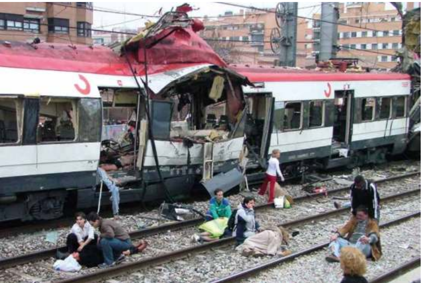
Víctimas del atentado del 11-M de 2004 recibiendo ayuda.