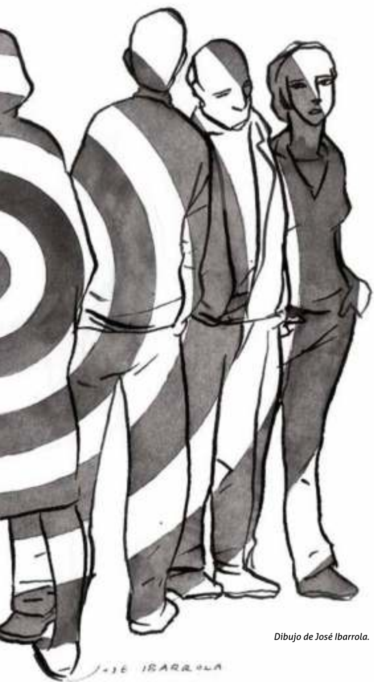
Dibujo de José Ibarrola.

Son muy importantes los conocimientos adquiridos, el análisis de tus emociones y sentimientos, la reflexión acerca de lo que hacemos ante las víctimas de violaciones de derechos humanos (en concreto del terrorismo), así como su petición de memoria, justicia, verdad y reparación.