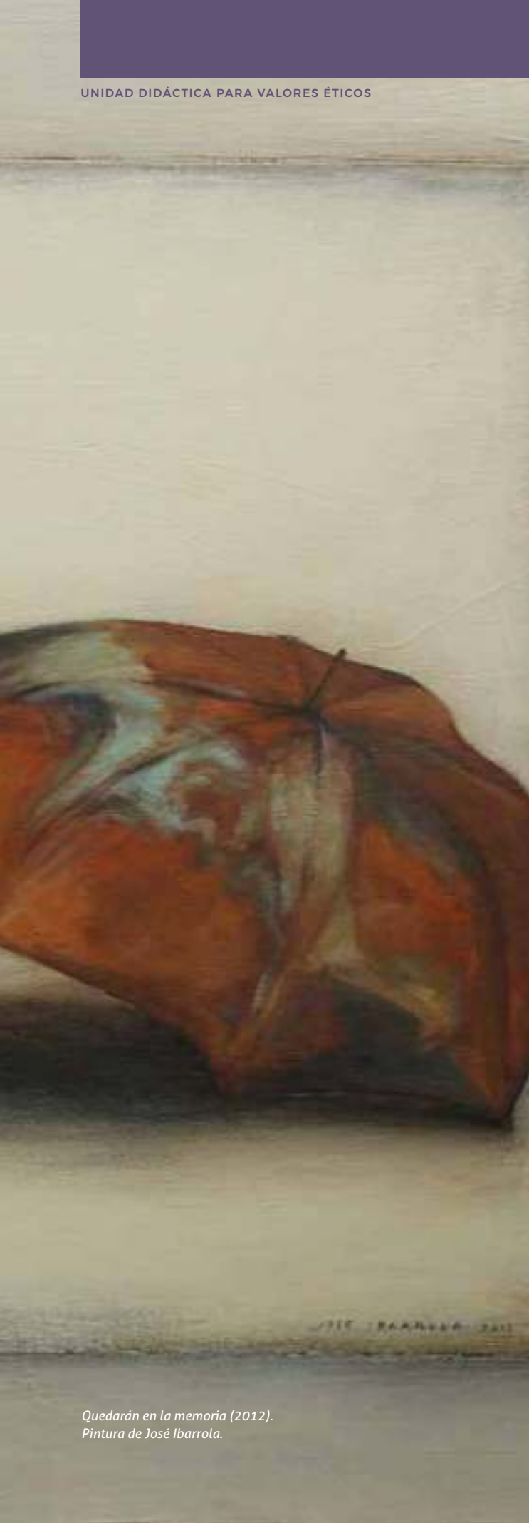
Quedarán en la memoria (2012). Pintura de José Ibarrola.