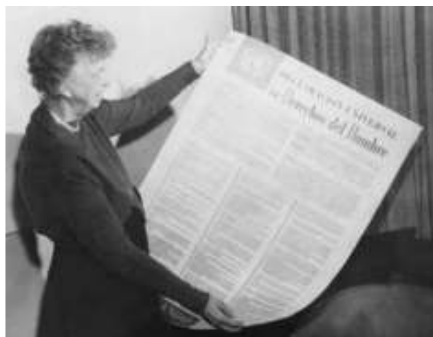
Eleanor Roosevelt con la DUDH en español. Noviembre 1949.