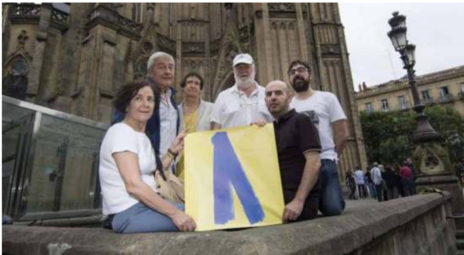
Imagen del reportaje El secuestro que desató el lazo azul .