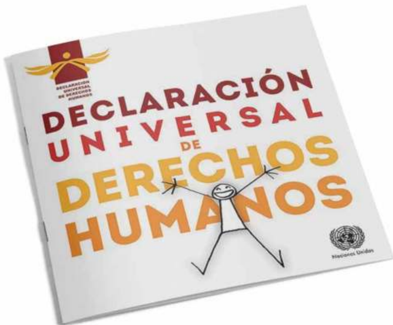
Edición de la DUDH ilustrada por Yacine Ait Kaci (YAK) y publicada por Naciones Unidas.

No hay unos derechos que sean más importantes que otros y todos están interrelacionados. Suponen garantías jurídicas universales que protegen a todas las personas en cualquier sociedad. La forma más clara de darse cuenta de su relevancia es, precisamente, cuando estos se niegan a alguien. Por eso, se aprecia mejor su importancia cuando se está cerca de quien ha sido privado de ellos, de la víctima de una injusticia. Como señala el filósofo Xabier Etxeberria: «la auténtica revelación de los derechos humanos, de lo que son y suponen, no se nos da en abstracto, se nos da en la vivencia en nosotros, o la percepción empático-moral en los otros, de la negación de esos derechos».