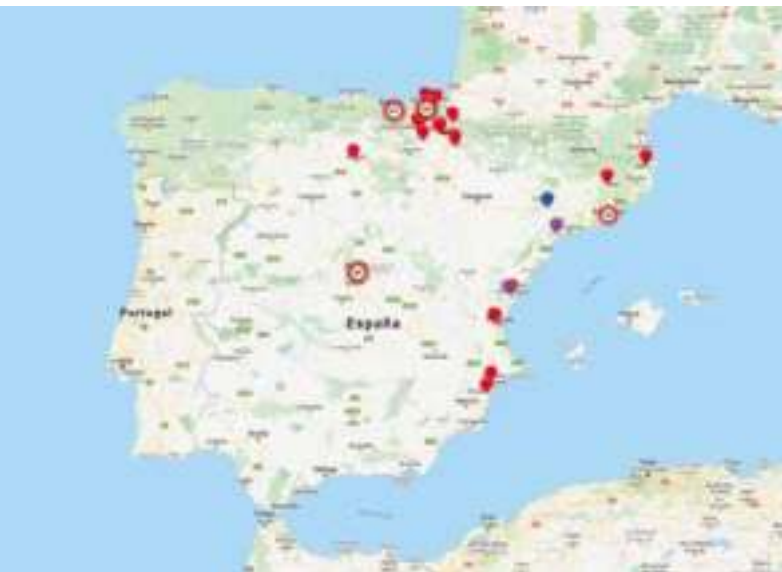
Mapa del terror de Covite: https://mapadelterror.com

Lamentablemente esta vulneración de los derechos humanos ocurre en buena parte del mundo y también muy cerca de ti. Hay un dato estremecedor: solo en España, casi 1500 personas han perdido la vida como consecuencia de actos terroristas desde 1960.