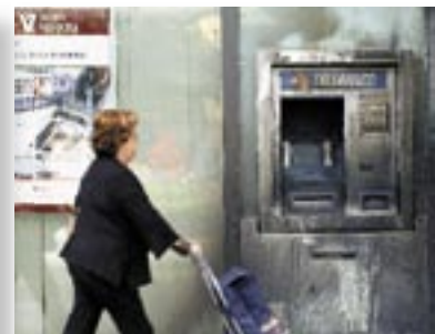
Durante el otoño han sido habituales la quema de vehículos de transporte público, cajeros automáticos y sedes de partidos políticos.