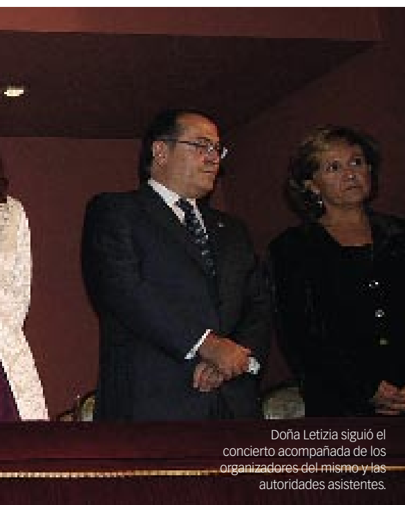
Doña Letizia siguió el concierto acompañada de los organizadores del mismo y las autoridades asistentes.