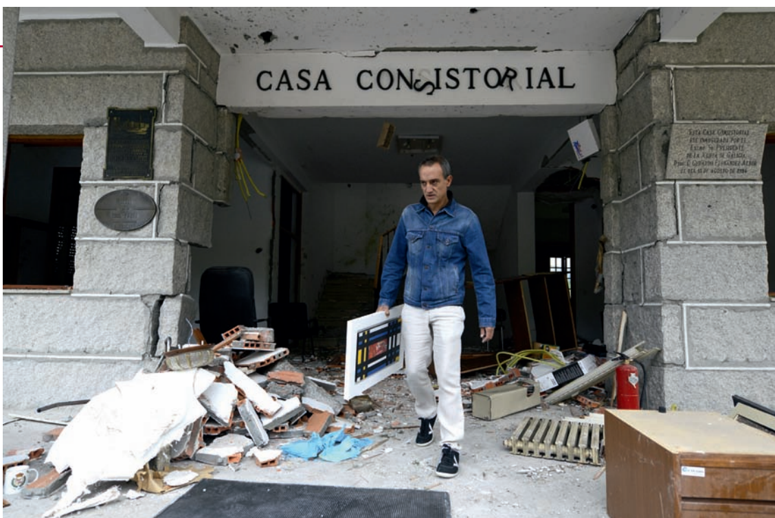
Efectos de la explosión de un artefacto en el Ayuntamiento de la localidad orensana de Beade.