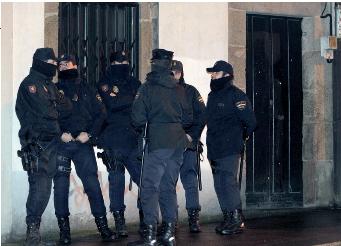
La Policía realiza un registro en una vivienda de Santiago de Compostela relacionada con Resistencia Galega.