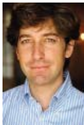
POR ROGELIO ALONSO

E n los años noventa los grupos de extrema derecha noruegos constituían una problemática lo suficientemente preocupante como para inspirar programas de desradicalización imitados en otros países escandinavos. El temor a que expresiones de violencia surgidas en aquellos años escalaran fue precisamente lo que motivó la salida de esos grupos de diversos activistas, como revelan los trabajos de Tore Bjørge, académico noruego que entrevistó a algunos de ellos. Existía pues un germen para una violencia como la que ahora se ha materializado en una proporción muy superior a la contemplada previamente y que resultaba, por varios motivos, difícil de prever.