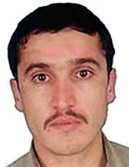
Atiyah Abd al Raham estaba considerado como 'número dos' de Al Qaeda. Con su muerte la organización criminal se queda sin una de sus piezas clave.

Si para el futuro le habían reservado grandes empresas terroristas es porque Al Rahman contaba con un currículo acreditado como mujahidin . Prueba de ello es que durante años desempeñó la labor de enlace entre Al Qaeda y los grupos yihadistas de Oriente Medio y el norte de África. Por este motivo, en 1993 fue destinado a Argelia para que sentara las bases de estas relaciones, pero las tensiones internas que en ese momento se vivían en el seno del islamismo radical impidieron que obtuviera resultados. La pugna fue tan intensa que Al Rahman fue expulsado por aquellos a los que tenía que captar. Pero esto no supuso ninguna merma en