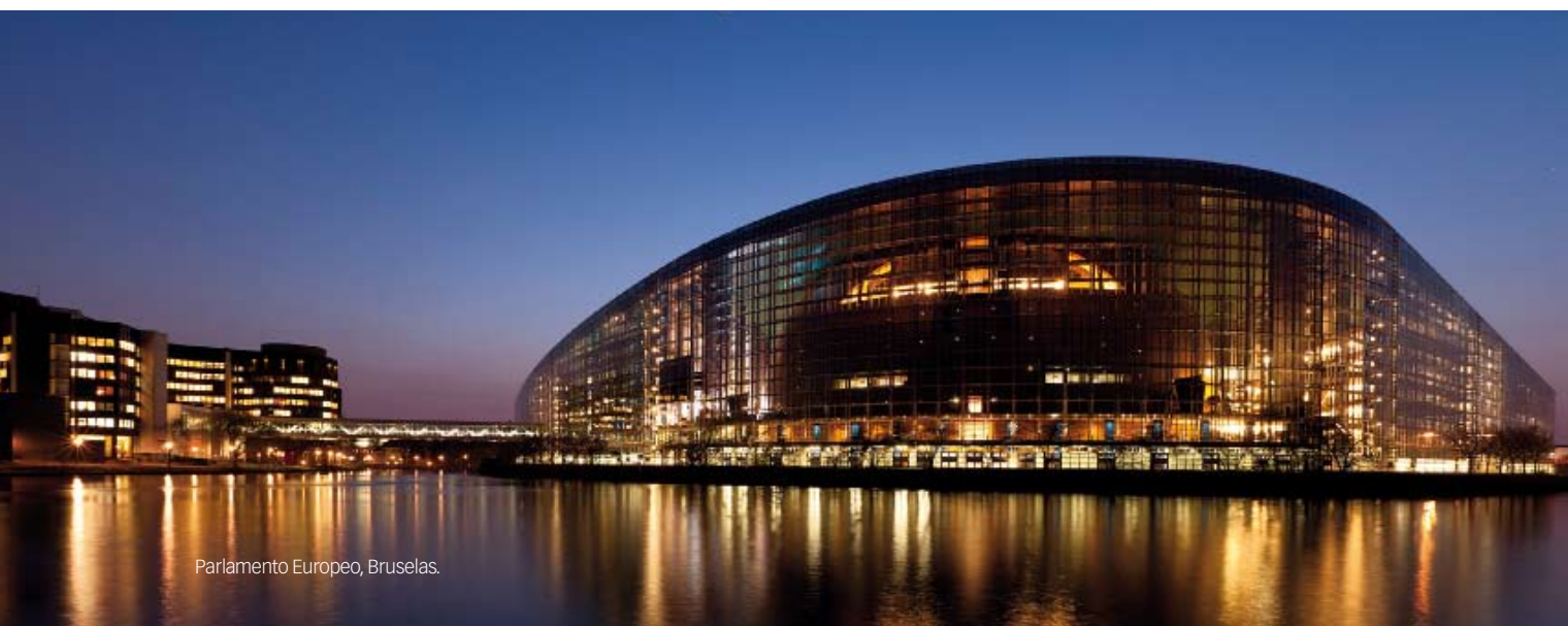
Parlamento Europeo, Bruselas.

La presidenta de la Fundación se mostró confiada en que este tipo de iniciativas contribuyan a que "no haya impunidad" y no quede "un espacio vedado a la justicia". En este sentido, lamentó que los "victimarios" de las acciones terroristas "se sienten virtuosos y aspiran a la impunidad", pese a ejercer una forma "cruel" de delito. "Desde luego, esperamos que también las instancias internacionales puedan ayudar a que eso nunca pase, que no ocurra más, porque ya ha pasado más de una vez", concluyó. ■