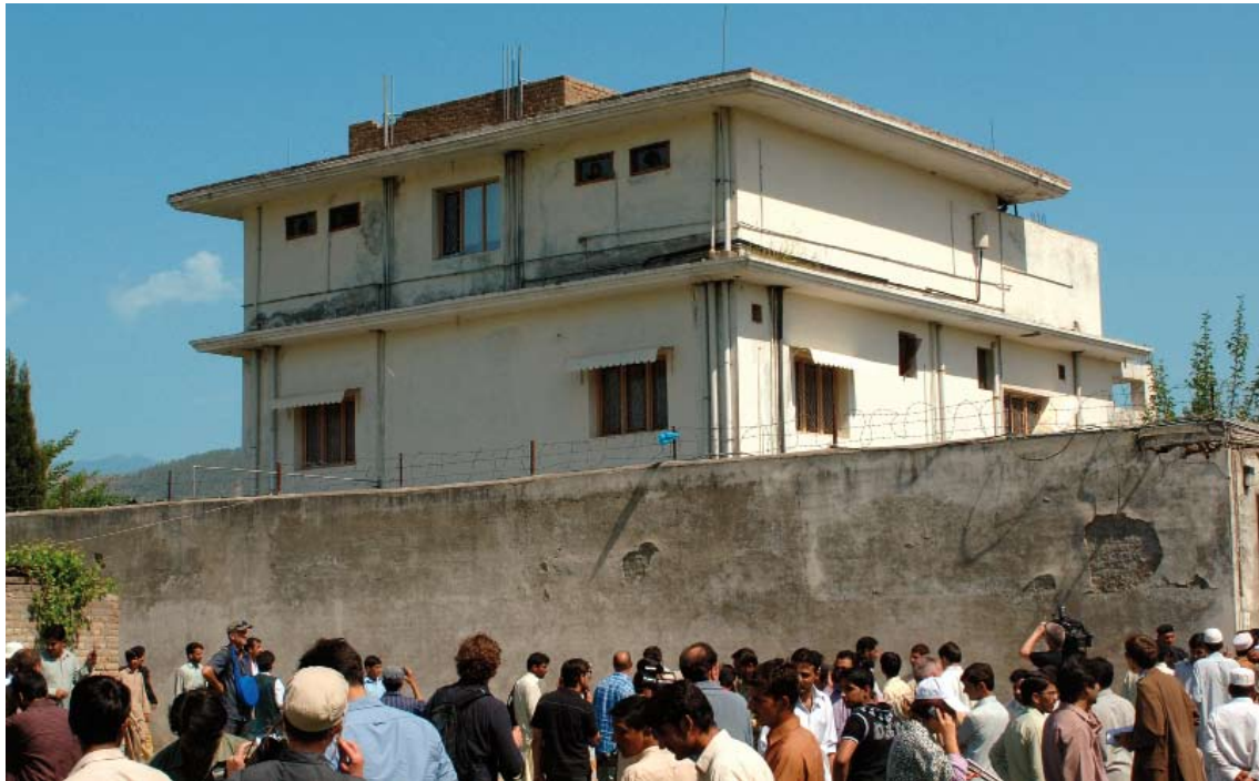
La administración Obama ha eliminado en dos operaciones de guerra a Bin Laden (en la fotografía la casa en la que fue abatido) y al 'número dos' de Al Qaeda.

llamadas a los siguientes teléfonos chinos: 0086/13710236554 y 0086/13556171218. De nuevo, la colaboración de "servicios amigos" reveló que el usuario de esos dos números de móvil era Abu Abdullah Sadeq, también conocido como Abd al Hakim Beldahj y Mohamed bin ali Mohsen, quien en abril de 2004 se encontraba en arresto domiciliario en Libia tras haber sido extraditado por China.