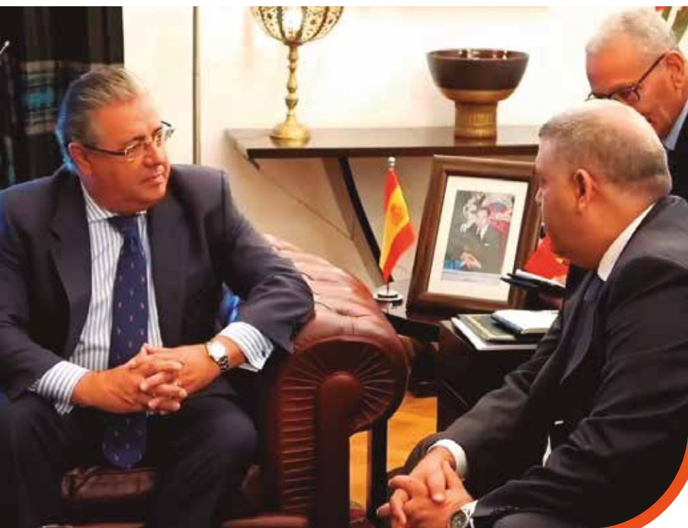
El ministro del Interior español, Juan Ignacio Zoido, durante la reunión que mantuvo en Rabat, tras los atentados de Cataluña, con su homólogo marroquí, Abdelouafi Laftit.

Jóvenes, residentes en Cataluña, principalmente en la provincia de Barcelona, y mayoritariamente de origen marroquí