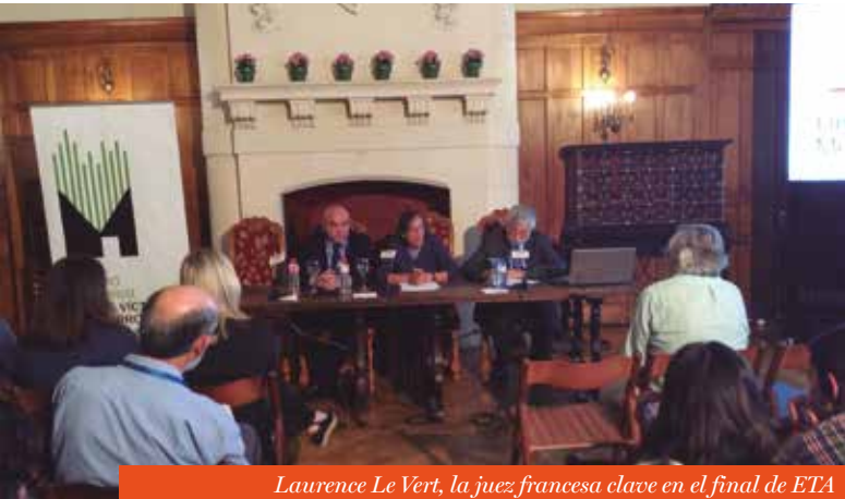
Laurence Le Vert, la juez francesa clave en el final de ETA