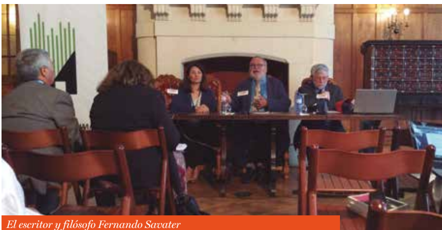
El escritor y filósofo Fernando Savater