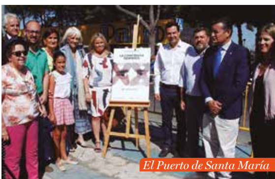
El Puerto de Santa María