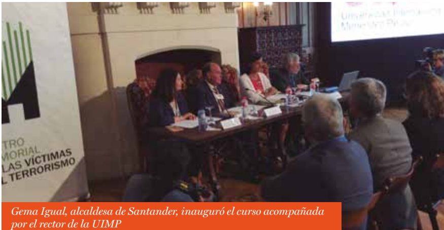
Gema Igual, alcaldesa de Santander, inauguró el curso acompañada por el rector de la UIMP