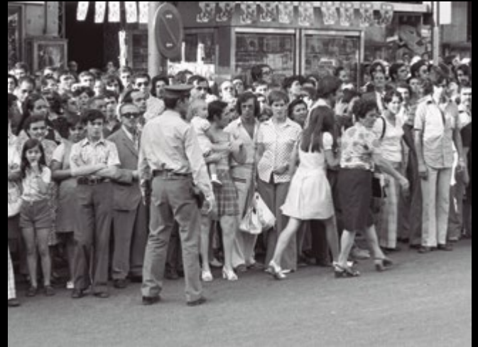
Madrid, 13-09-1974.- Grupo de ciudadanos en las inmediaciones de la cafetería Rolando tras la explosión a primera hora de la tarde de un potente artefacto.