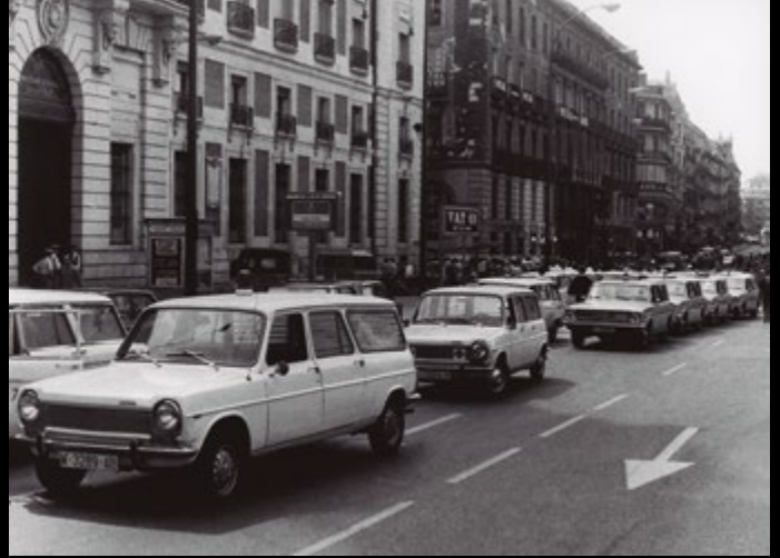
Madrid, 13-09-1974.- Una caravana de ambulancias acuden al lugar del atentado para efectuar el traslado de los heridos a los centros sanitarios.