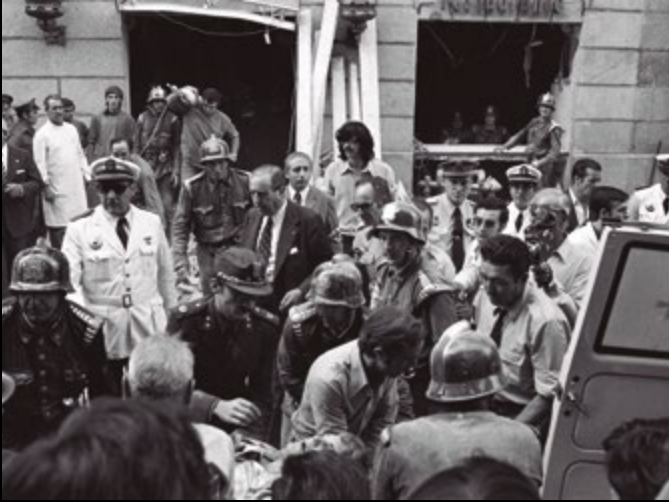
Madrid, 13-9-1974.- En las imágenes, miembros del cuerpo de Bomberos de Madrid evacúan a las víctimas del atentado.