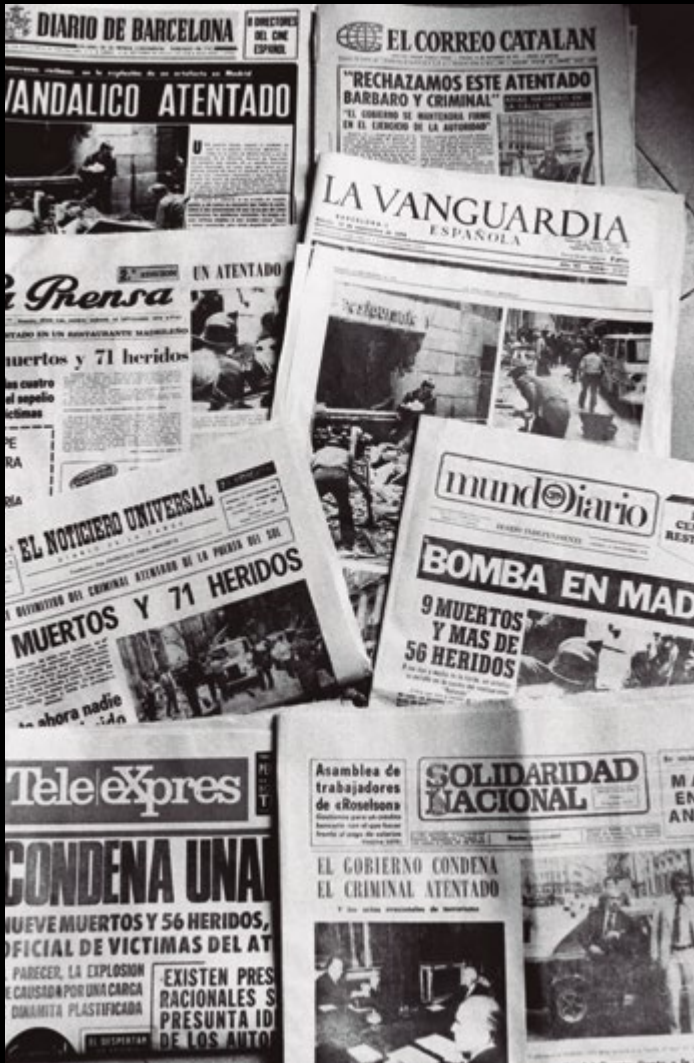
Madrid, 14-9-1974.- Portadas de los diarios de información que se hacen eco de la noticia.