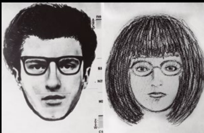
Madrid, 27-09-1974.- La policía facilitó dos retratos robot de los sospechosos que fueron vistos el día del atentado, y una descripción física de sobre su estatura, color de pelo y vestuario.