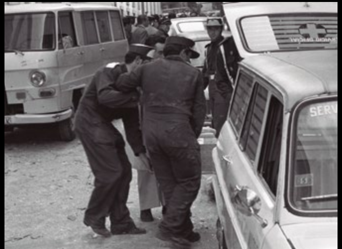
Madrid, 13-09-1974.- Personal de emergencias traslada en ambulancia a los heridos en el atentado.