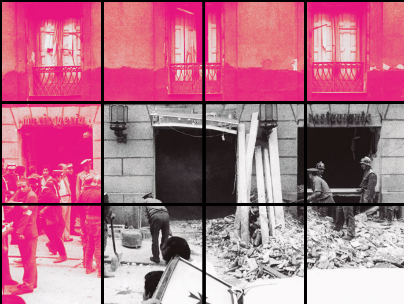
MADRID, 13/09/1974.- Un artefacto hizo explosión a primeras horas de la tarde en la cafetería Rolando, situada en la calle del Correo, frente a la fachada lateral de la Dirección General de Seguridad.