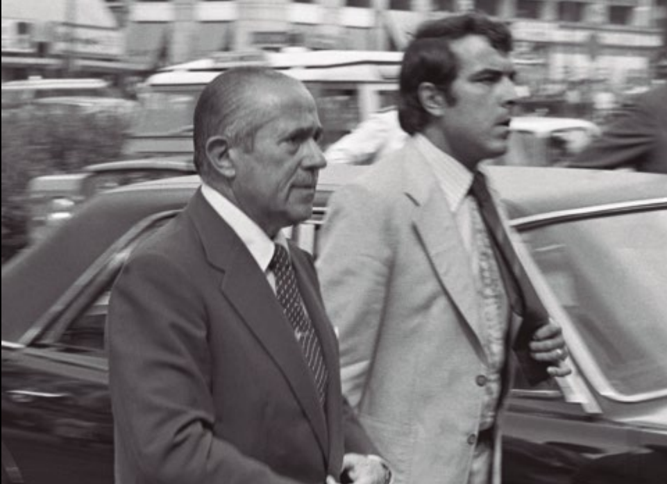
Madrid, 13-09-1974.- El presidente del Gobierno, Carlos Arias Navarro, a su llegada a las inmediaciones de la cafetería Rolando, donde un artefacto hizo explosión a primeras horas de la tarde causando la muerte de once personas (al final serían trece las personas asesinadas) y resultando heridos más de setenta.