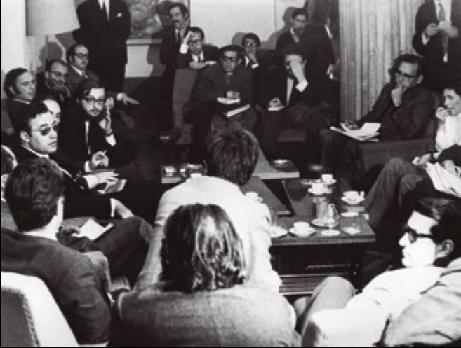
Burgos, 03-12-1970.- Gregorio Peces Barba y Juan María Bandrés, junto a otros abogados defensores del Proceso de Burgos, convocan una rueda de prensa.