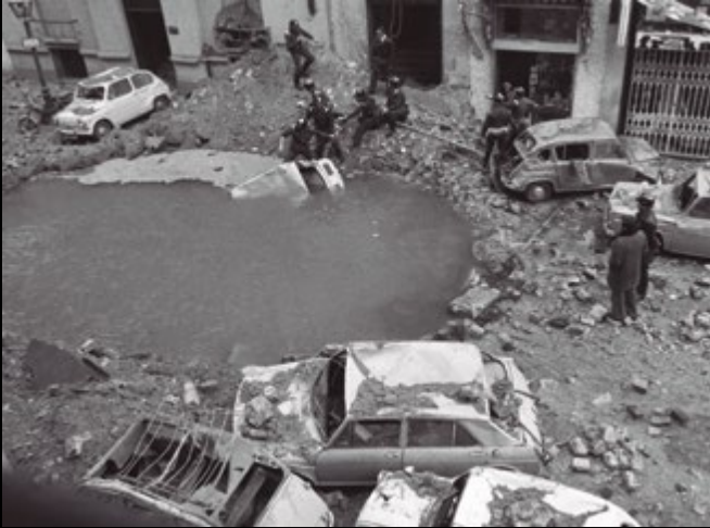
Madrid, 20-12-1973. El presidente del Gobierno, almirante Luis Carrero Blanco, y su conductor y escolta fallecieron en Madrid al explotar una bomba, compuesta por 50 kg de goma 2, en la esquina de las calles Maldonado y Claudio Coello al paso del automóvil en el que viajaban. El artefacto fue colocado en el subsuelo por el comando Txikia de ETA, que cavó un túnel desde el interior de un piso bajo hasta el centro de la calzada.