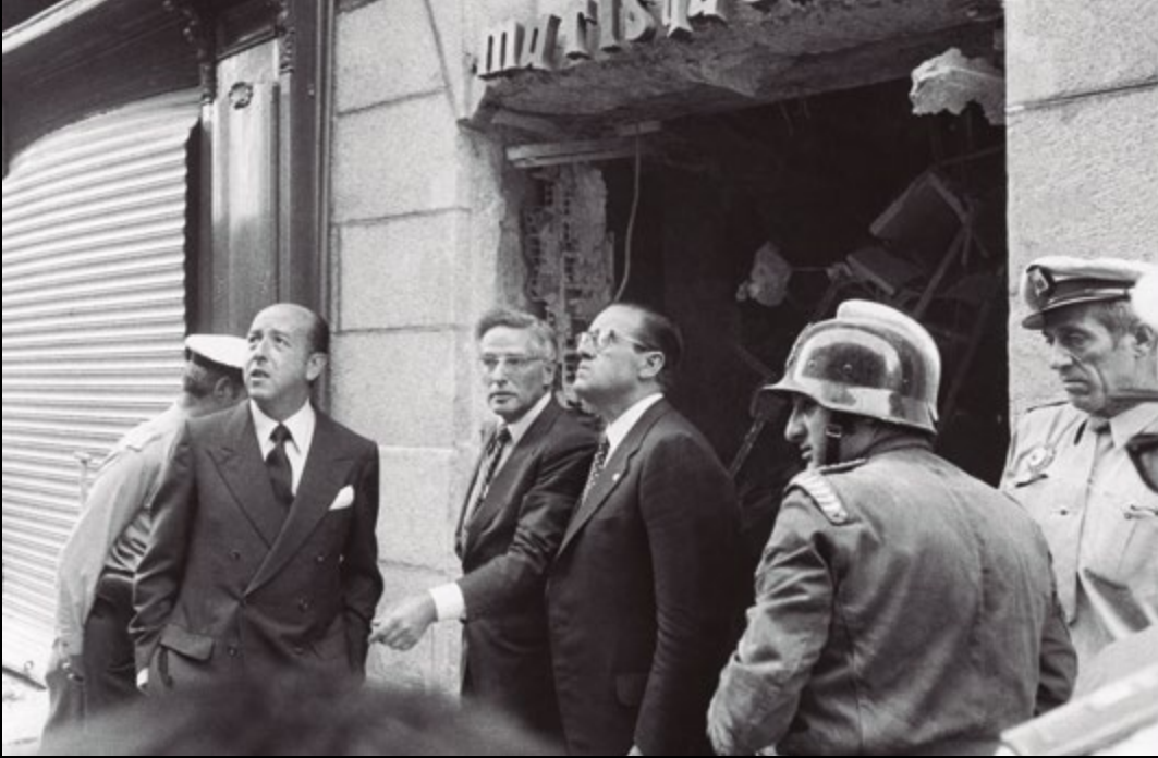
Madrid, 13-09-1974.- En la imagen, el ministro Secretario General del Movimiento, José Utrera Molina (1); el ministro de Planificación del Desarrollo, Joaquín Gutiérrez Cano (2), y el jefe Superior de Policía.