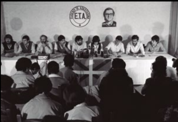
Biarritz (Francia), 30-9-1982.- ETA político-militar anuncia en su VII Asamblea en la ciudad francesa su disolución como organización armada. Los miembros de ETA, que por primera vez han comparecido sin capuchas ante la prensa, afirmaron en su comunicado tener confianza en que las “medidas de gracia” son un cauce para la normalización y la pacificación en Euskadi.