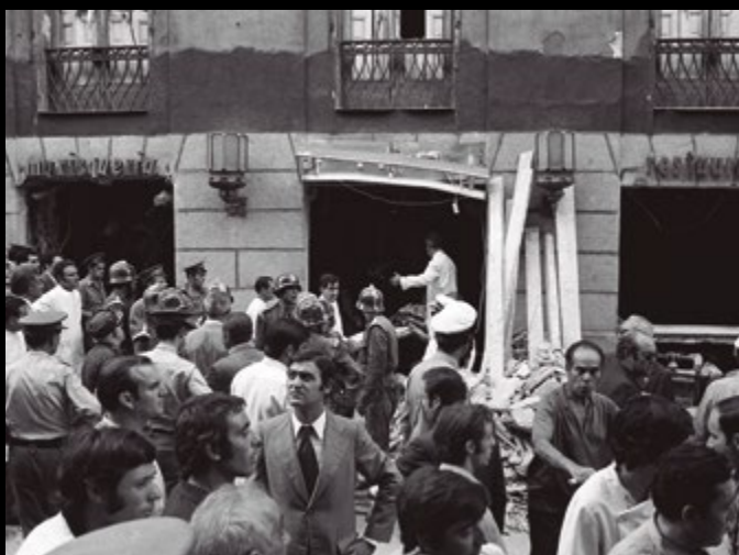
Madrid, 13/09/1974. Un grupo de operarios participa en las labores de rescate de las personas que se encontraban en el interior de la cafetería Rolando después de la explosión del artefacto bomba colocado por la banda terrorista ETA, que ocasionó el derrumbe del techo.