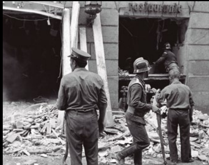
Madrid, 13/09/1974.- En las imágenes, los miembros de los cuerpos de seguridad, operarios de bomberos y del Ayuntamiento de Madrid, junto a sanitarios, participan en las labores de rescate y desescombro.